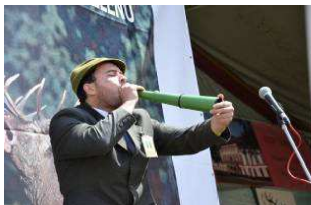
Národní myslivecké slavnosti