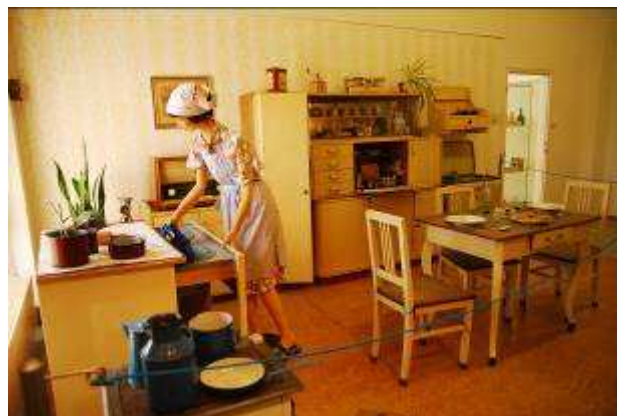
Dobré jídlo, dobré pití prodlužují životy